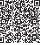
看護師のまなびサポートブック (日本看護協会発行)